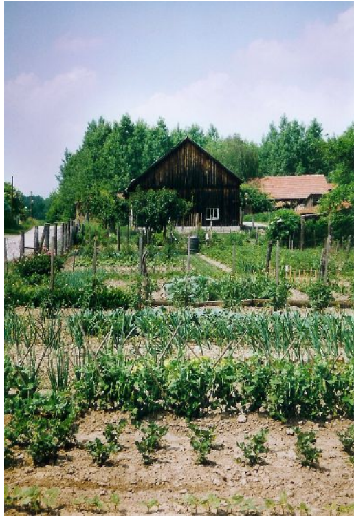
Die Au der Donau und Fladnitz bieten teilweise noch unberührte Natur.