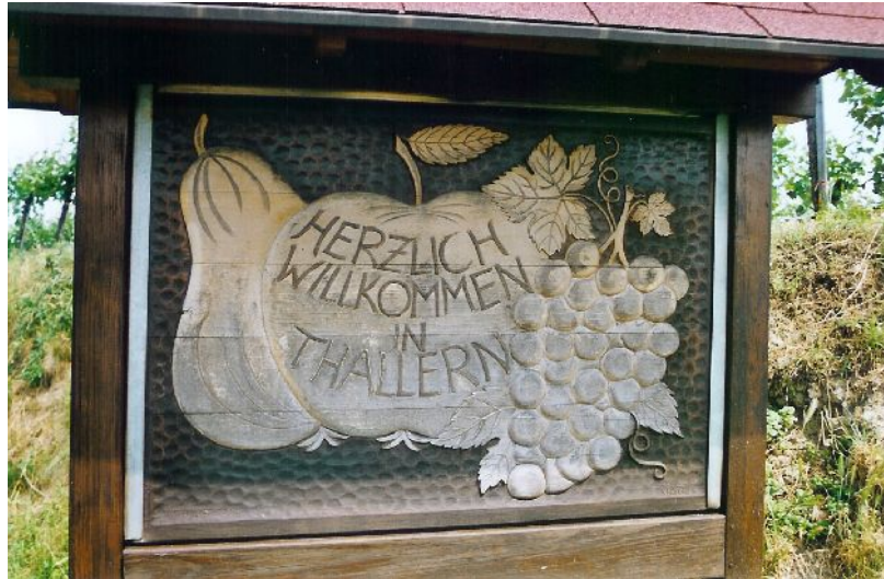
Die Kulturlandschaft in und um Thallern wird geprägt vom Obst und Weinbau.